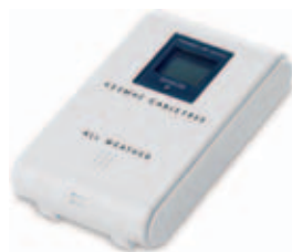
20821.S Multifunkční meteostanice s bezdrátovým venkovním čidlem, stolní i nástěnná

220 x 71 x 25 mm tampoprint, laserový popis