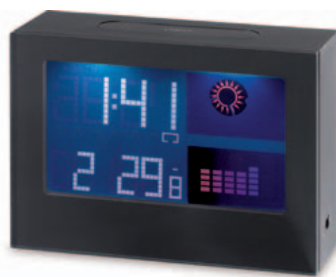
51024.C Meteostanice s barevným pozadím