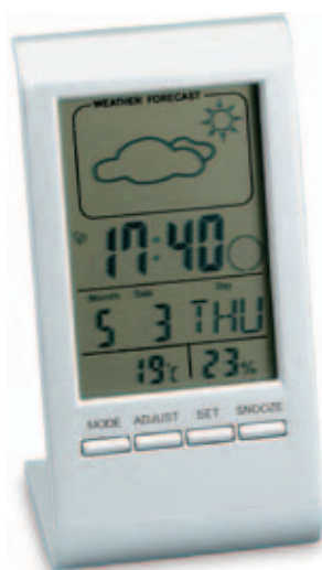
42671.S Digitální meteostanice