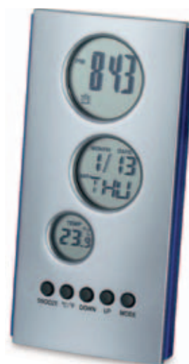
42450.M Multifunkční hodiny s teploměrem