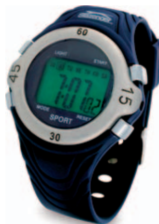
30378.M Sportovní hodinky SLAZENGER