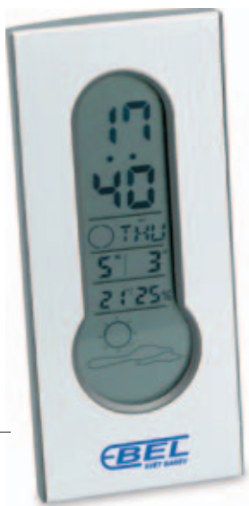
42670.S Digitální meteostanice

60 × 136 × 24 mm tampoprint, laserový popis