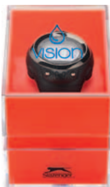
30379.C Digitální sportovní hodinky se stopkami SLAZENGER