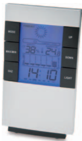
30376.S Multifunkční meteostanice