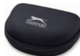
31005.C Multifunkční hodinky SLAZENGER s měřením tepu a hrudním pásem

190 × 150 × 80 mm tampoprint, laserový popis