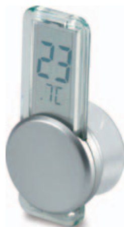
51361.S Digitální teploměr s přísavkou