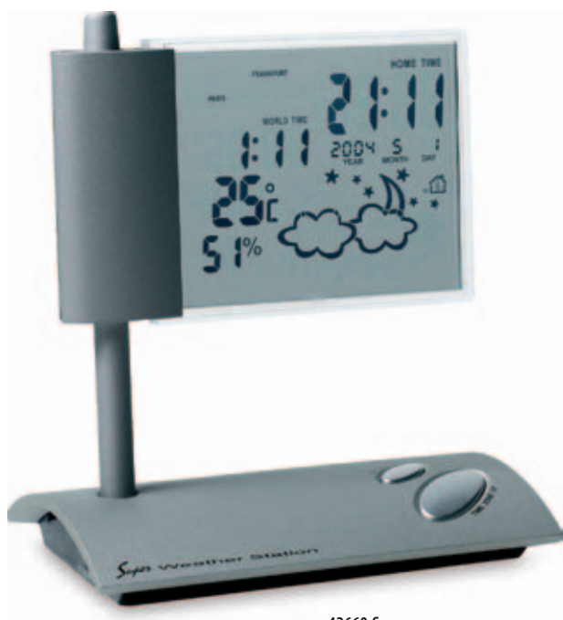
42660.S Hodiny s meteorologickými údaji

125 x 140 x 80 mm tampoprint, laserový popis