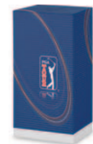
31001.C PGA TOUR golfové hodinky, 18 jamek, handicapy, 20 pamětí