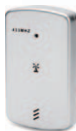
28452.Q Multifunkční meteostanice s bezdrátovým venkovním čidlem