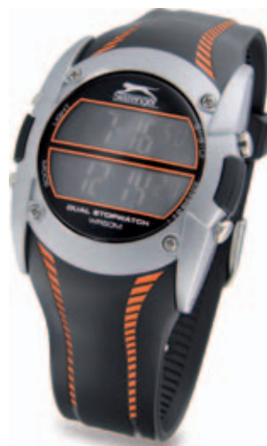
30372.Q Duální sportovní hodinky SLAZENGER