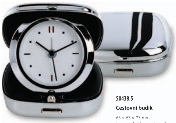
50438.S Cestovní budík

65 × 63 × 23 mm tampoprint, laserový popis