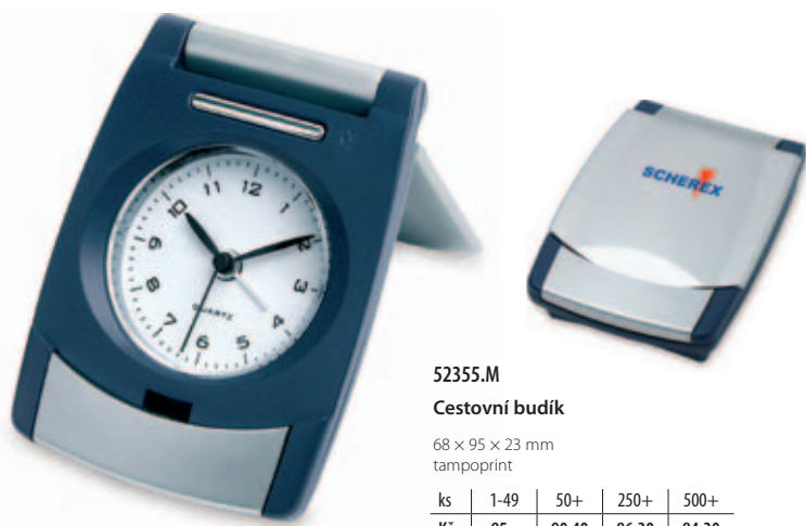
52355.M Cestovní budík